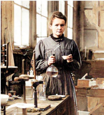
MARIE CURIE 1867- 1934

En ce qui concerne la situation des femmes, jusqu'à la première décennie du 20ème siècle, elles étaient reléguées aux tâches domestiques. Dans le domaine du travail, l'usine excluait les femmes, surtout les femmes mariées, qui devaient s'occuper des enfants et de la maison. Seules quelques-unes, principalement des femmes célibataires, avaient accès à des emplois d'ouvrières, mais leurs salaires étaient inférieurs à ceux des hommes. Cependant, la Première Guerre mondiale a provoqué un profond changement pour les femmes en leur faisant jouer un rôle essentiel à la maison, au travail et dans la société en général. Les femmes sont enrôlées de force pour travailler dans les usines de munitions, ce qui augmente considérablement la main-d'œuvre civile pour remplacer les hommes envoyés au front. Malgré tout, la guerre permet aux femmes de jouer un rôle plus important dans la société, comme en témoigne l'exemple de Maria Salomea Skłodowska-Curie[6], plus connue sous le nom de Marie Curie, physicienne et chimiste polonaise naturalisée française. Elle est une pionnière dans le domaine de la radioactivité. Pendant la guerre, elle a pro-